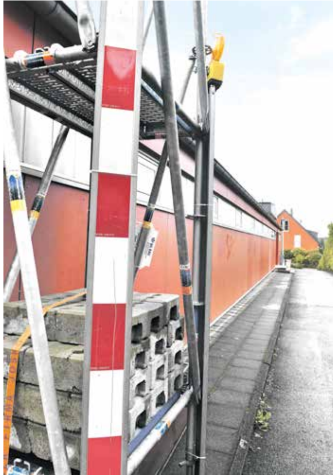
Von außen zeugt ein Gerüst von den Bauarbeiten, die in den Osterferien begonnen haben.

Begonnen haben die Arbeiten im Umkleide- und Sanitärbereich zum Start der Osterferien am 28. März. Geplant ist, dass die Arbeiten bis zum Ende der Sommerferien am 1. September dauern. Die Turnhalle bleibt zwischen den Oster- und Sommerferien geöffnet und war in den Osterferien vom 28. März bis 12. April gesperrt. Auch in den Sommerferien vom 20. Juli bis 1. September wird die Halle wegen der Bauarbeiten gesperrt.