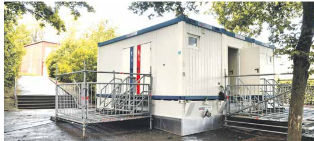
Als Ersatz für den wegen der Umbauarbeiten gesperrten Umkleide- und Sanitärbereich hat die Stadt auf dem Schulhof der Grundschule Echoer Straße einen Container aufgestellt.