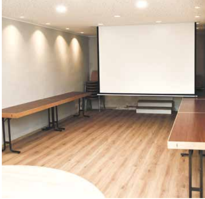
Eine ausfahrbare Leinwand wertet den umgebauten Raum auf.

und Feiern der Übungsgruppen, Kindergeburtstage, Lesungen, Filmabende oder ähnliche