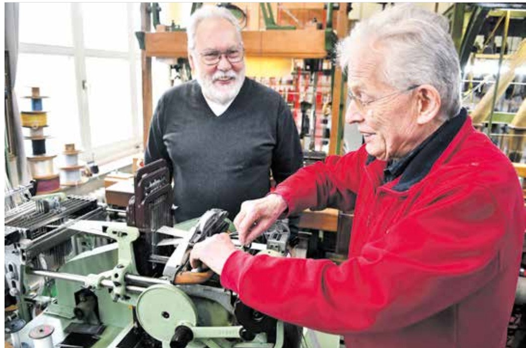
Der Spaß kommt bei der ehrenamtlichen Arbeit nicht zu kurz.