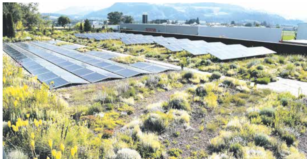
Eine gute Kombination: Photovoltaik und Gründach.