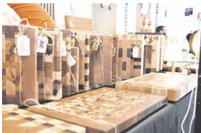
...Stirnholz-Schneidebretter oder selbsthergestellte Kerzen mit Verzierungen waren beispielsweise zu haben.