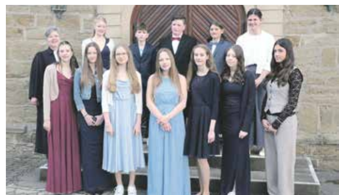
In zwei Festgottesdiensten wurden am Samstag und Sonntag insgesamt 22 Jugendliche in der Lutherkirche konfirmiert.