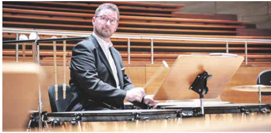
Das 8. Sinfoniekonzert findet am Sonntag, 26., und Montag, 27. April, im Großen Saal der Stadthalle statt.

Mit Grażyna Bacewicz widmet sie sich einer der wichtigsten polnischen Komponistinnen des 20. Jahrhunderts, die zugleich selbst eine herausragende Geigerin war. Ihr Violinkonzert Nr. 7 vereint virtuose Brillanz mit rhythmischer Prägnanz und farbenreicher Klangsprache. Ein Werk, das nach dem Tod der Komponistin lange zu Unrecht in Vergessenheit