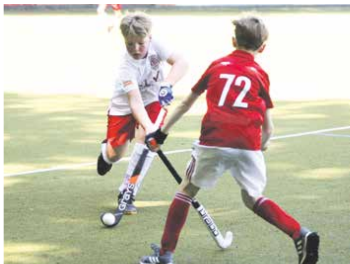
Am Samstag können Interessierte Hockey ausprobieren.

Die Teilnahme ist kostenlos. Mitzubringen sind lediglich Sportkleidung und Turnschuhe; Schläger und Bälle stellt der Verein bereit. Eine Anmeldung per E-Mail