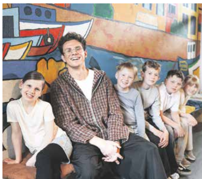
100 Kinder- und Jugendeinrichtungen können neue Böden bekommen.

Gemeinsam aktiv sein und dabei Gutes tun: Genau das steht auch 2026 wieder im Fokus der bundesweiten LaminatDEPOT-Laufchallenge. Im Rahmen von Deutschlands größtem Charity-Renovieren gilt es, im Aktionszeitraum insgesamt 250.000 Kilometer laufend oder walkend zu sammeln. Wird dieses Ziel erreicht, unterstützt das LaminatDEPOT 100 gemeinnützige Kinder- und Jugendprojekte mit jeweils 50 Quadratmetern Bodenbelag. Der Gesamtwert der Förderung beträgt 150.000 Euro.