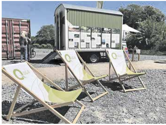
Einladende Liegestühle und viele Informationen.

Mit dem ersten „Quga-Buga-Baum“ wird die Verbindung von Quartiersgartenschau und Bundesgartenschau (Bug) 2031 symbolisch sichtbar. Der Rotahorn auf dem Gutenbergplatz steht für