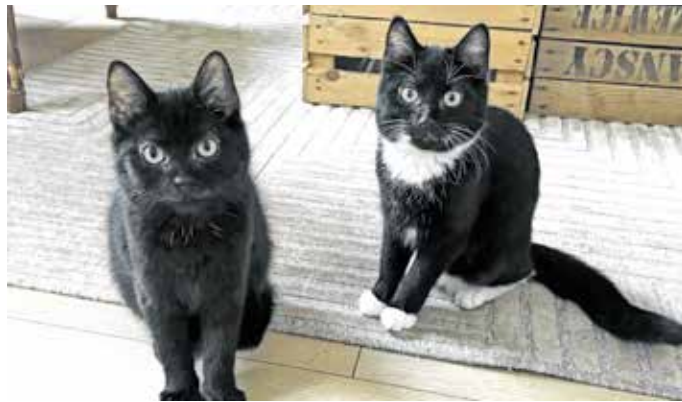
Pikachu (links) ist verschmust, Evoli noch etwas zurückhaltend, aber neugierig.

Aktuell suchen Pikachu (schwarz) und Evoli (schwarz/weiß), zwei ca. 4 Monate alte Geschwister, ein neues Zuhause. „Beide sind lebhaft und verspielt und haben sich toll in ihrer Pflegestelle entwickelt. Evoli ist inzwischen sehr verschmust und liebt Streicheleinheiten, während Pikachu noch etwas zurückhaltend, aber neugierig ist und zunehmend Nähe zulässt“, so der Verein und ergänzt: „Die beiden hängen sehr aneinander und werden nur gemeinsam vermittelt. Gesucht wird ein liebevolles Zuhause mit der Möglichkeit auf Freigang oder alternativ Wohnungshaltung mit ausreichend