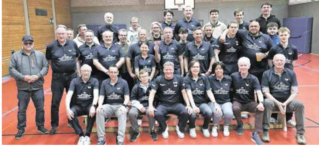
Zufriedene Gesichter beim TTV Ronsdorf nach dem letzten Sieg.