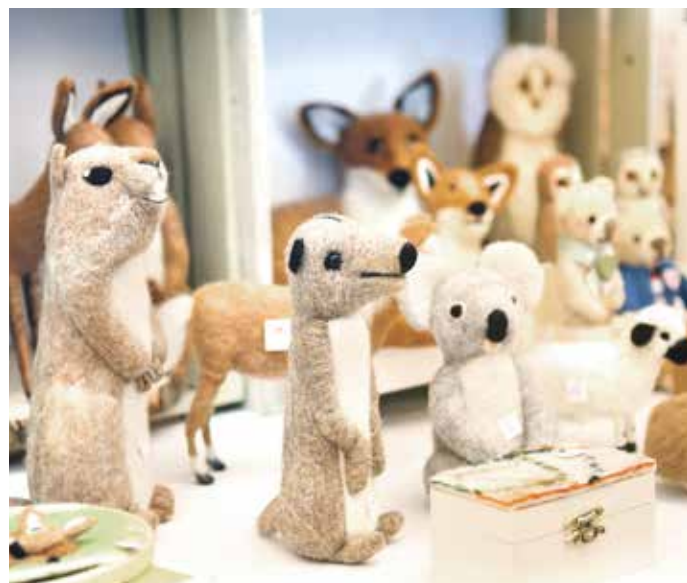
Von der Tierwelt über handgemachte Körbe, Taschen, Dekoartikel oder Wohnaccessoires bis zur Unterwasserwelt mit Unikaten aus Ton war der Kreativität kaum eine Grenze gesetzt.