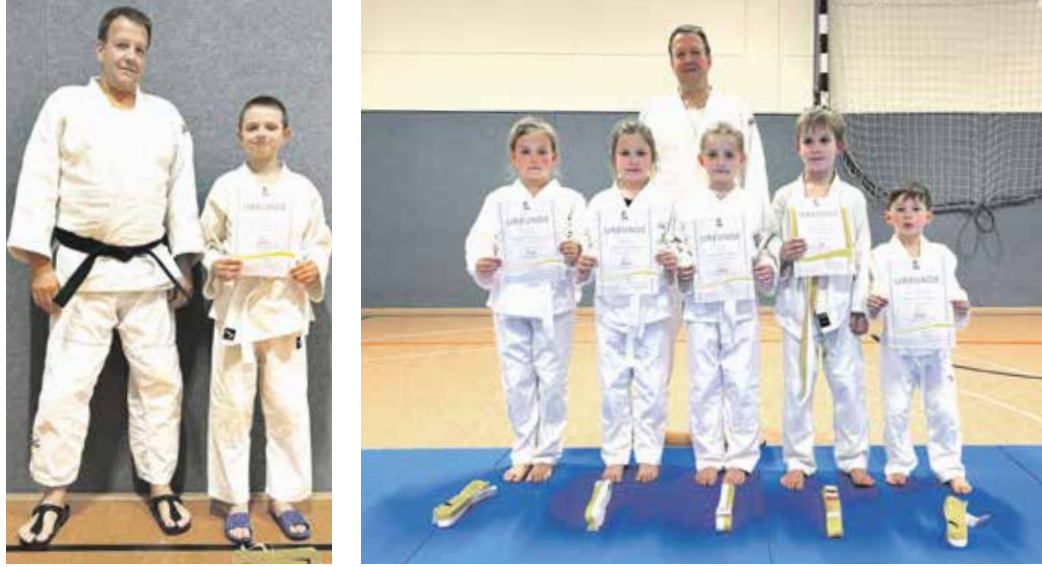
Die Kinder freuten sich über ihre Erfolge und präsentierten stolz ihre Urkunden.