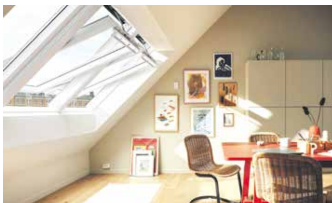
Elektrische oder solarbetriebene Dachfenster öffnen und schließen sich zu vorher festgelegten Zeitpunkten.

Jedoch schaffen es nur die Wenigsten, im Alltag so häufig zu lüften. Und das liegt nicht allein daran, dass es zu mühsam ist, sondern man dafür schlichtweg gar nicht jeden Tag lange genug zu Hause ist. Das Problem lässt sich mit automatisierten Fenstern lösen. So gibt es etwa von Velux elektrische oder solarbetriebene Dachfenster, die sich zu vorher festgelegten Zeitpunkten allein öffnen und wieder schließen. Bei Regen bleiben sie dank der Ausstattung mit einem Regensensor geschlossen. Noch weiter perfektioniert das Smart Home System Velux Active die energieeffiziente Regulierung des Raumklimas: Sensoren prüfen u.a. Luftfeuchtigkeit und CO 2 -Gehalt in der Raumluft und steuern die Fenster so, dass sie sich nur so lange öffnen, wie es für eine optimale Luftqualität notwendig ist. Effektiver kann man unnötige Energieverluste bei der Fensterlüftung kaum vermeiden. Mehr Infos unter www.velux.de/smart .