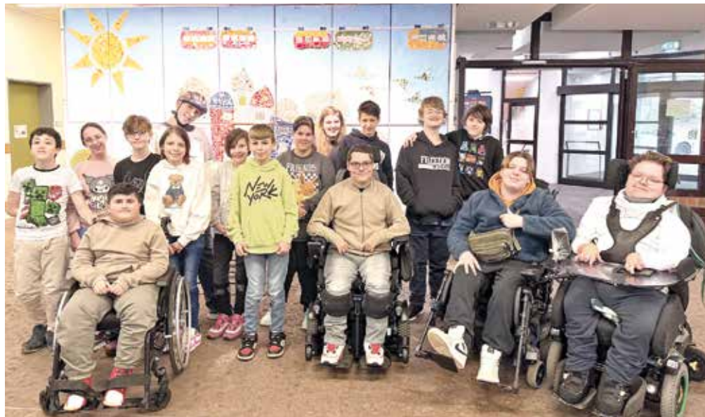
Im vergangenen Jahr freute sich die LVR-Förderschule über eine Spende in Höhe von 2.891 Euro.

Die Aktion findet am Freitag und Samstag, 24. und 25. April, in der neuen LaminatDEPOT-Filiale Wuppertal (Aue 46) statt. Das Prinzip ist einfach und bewährt: Von jedem am Aktionswochenende verkauften Quadratmeter Bodenbelag wie Laminat, Parkett oder Vinylboden geht umgerechnet ein Euro