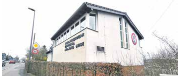
Das Gerätehaus auf Linde steht dem Ronsdorfer Löschzug nicht mehr zur Verfügung.