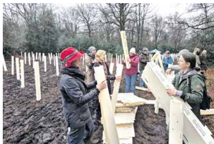
Mit biologisch abbaubaren Wuchshüllen werden die Setzlinge vor Witterung und Wild geschützt.

Schon im letzten Jahr hatten die Wirtschaftsjunioren Wuppertal (WJW), die Initiative Talbuddeln aus dem Verein Zukunft und Natur e.V. sowie das Forstamt im Ronsdorfer Talsperrenwald 1.100 Bäume gepflanzt. Am Samstag