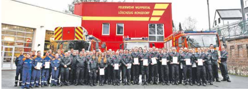
Der Ronsdorfer Löschzug mit der Jugendfeuerwehr (links).