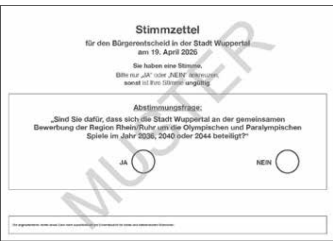
So sieht der Stimmzettel für die Entscheidung über die Olympia-Bewerbung aus.

Abstimmung über Teilnahme am 19. April – Auszählung in der Unihalle Die Abstimmung erfolgt über eine Ja-/Nein-Frage, die folgendermaßen lautet: „Sind Sie dafür, dass