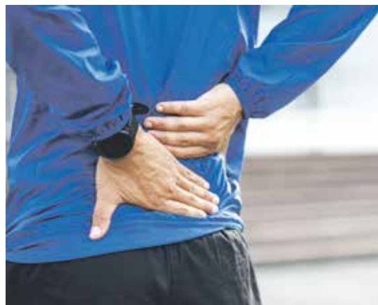
Rückenschmerzen sind weit verbreitet und schränken Betroffene stark ein. Orthesen können für Entlastung sorgen.

Wer unter Rückenschmerzen leidet, sollte sich jetzt seinen Termin für die Rücken-Testtage sichern. Diese finden statt: in der Filiale Ronsdorf, Erich-Hoepner-Ring 1, vom 16. bis 20. März und