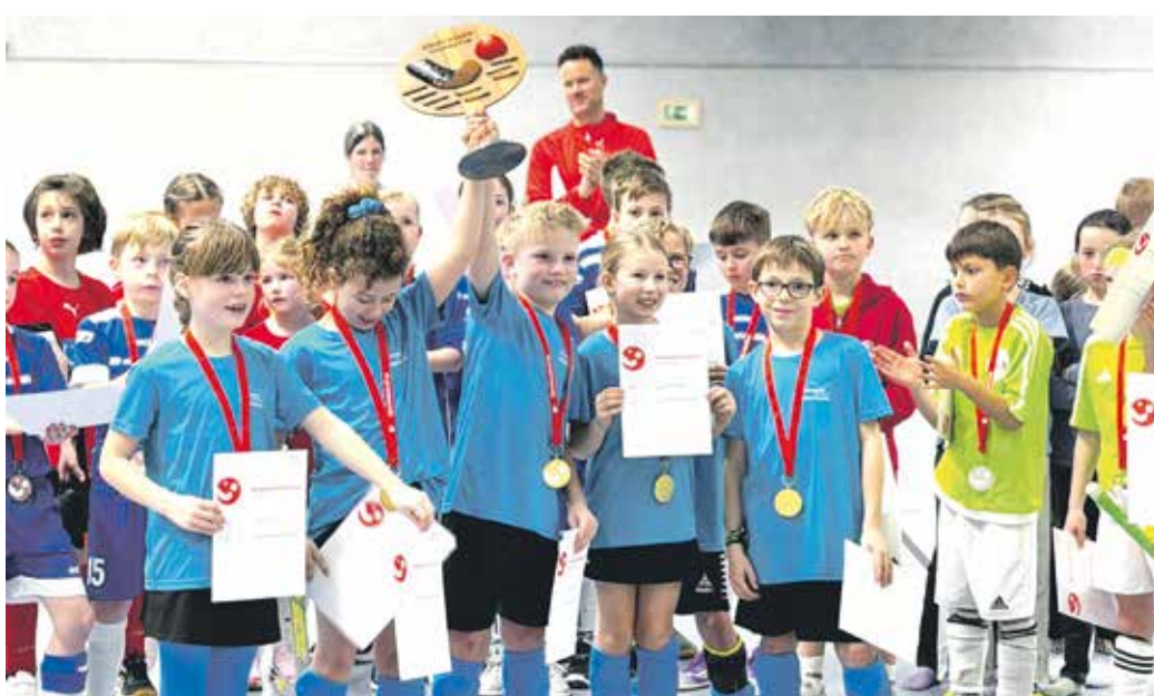
Das Siegerteam von der Grundschule Marper Schulweg konnte seine Erfolge aus der Vergangenheit wiederholen.

Das Prinzip des Sparkassen HockeyCups ist bewährt – und