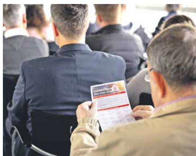
Die Besucher erhielten zahlreiche Infos rund um das Thema Immobilien – alles unter einem Dach.