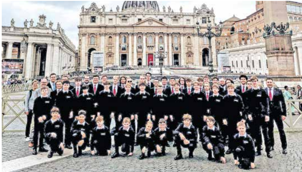
Die Wuppertaler Kurrende im Vatikan.

Die Probenarbeit erfolgt in klar strukturierten Gruppen, hochqualifizierte Chorleiter und Stimmbildner um den mu-