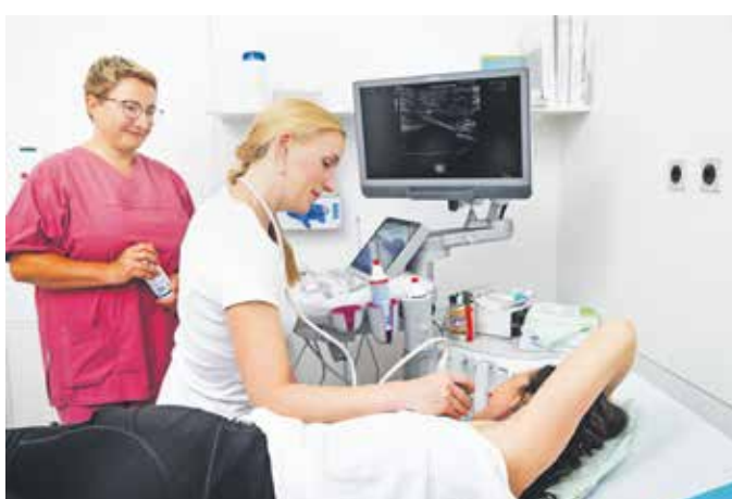
Im Brustzentrum finden die Untersuchungen statt.

In Deutschland erhalten jährlich mehr als 70.000 Frauen die Diagnose Brustkrebs. Allein im Brustzentrum Wuppertal werden rund 450 Neuerkrankungen pro Jahr behandelt. Brustkrebs ist damit die häufigste Krebserkrankung bei Frauen. Wird die Erkrankung frühzeitig erkannt, bestehen jedoch sehr gute Heilungschancen. Umso wichtiger sind sowohl die konsequente Vorsorge als auch eine regelmäßige, unabhängige Überprüfung und Bewertung der Behandlungsqualität in spezialisierten Brustzentren.