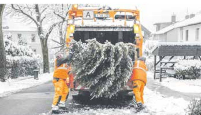
Die diesjährige Abholung der Weihnachtsbäume erledigte die AWG in einem verschneiten Wuppertal.

AWG-Geschäftsführer Sascha Grabowski: „Vielen Dank an die Wuppertalerinnen und Wuppertaler, einmal mehr waren fast alle ehemaligen Weihnachtsbäume vom Schmuck befreit und konnten somit ohne Probleme