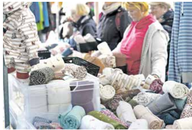
Eine große Auswahl an Stoffen für Mode und Accessoires sowie Dekostoffe bietet der Stoffmarkt am Samstag.

Zahlreiche Händlerinnen und Händler präsentieren eine große Auswahl an Stoffen für Mode, Kinderkleidung und Accessoires sowie hochwertige Dekostoffe für Wohnen und Interior. Ob Jersey,