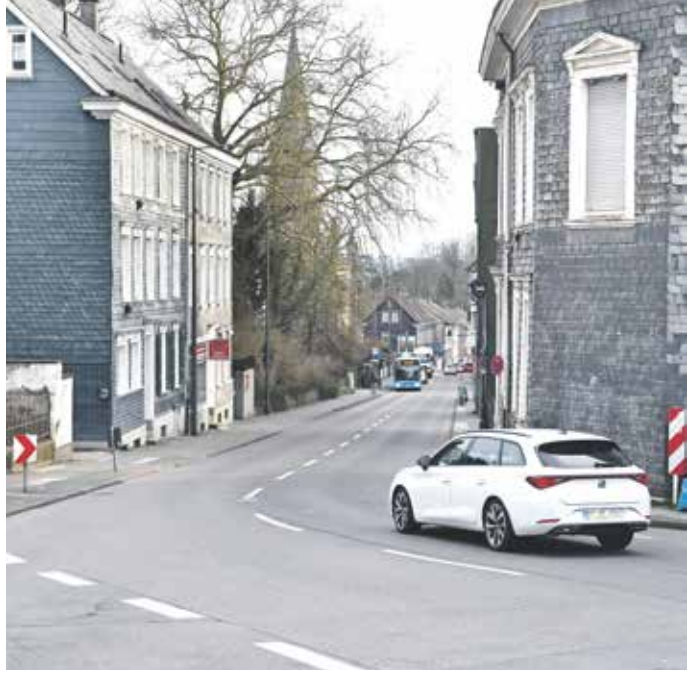
In der Kurve gilt zwar Tempo 30, danach 50 und im Ortskern wieder Tempo 30. Das will die Stadt ändern.

Von der Hausnummer 9 gilt bergab (in Richtung Ortskern) bereits Tempo 30. Bergauf ist in der Kurve an der Einmündung zur Staubenthaler Straße ebenfalls