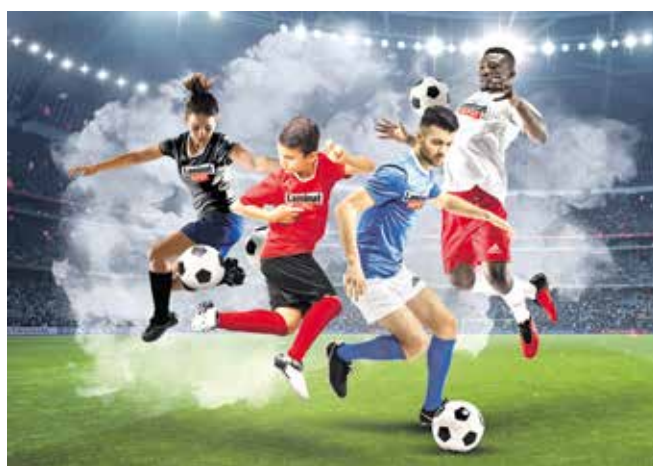
Das LaminatDEPOT sponsort 50 Fußballvereine mit neuen Trikots.

Die Spielregeln sind schnell erklärt: Interessierte Vereine können einen Original-Trikotsatz von Adidas beim LaminatDEPOT bestellen. Das 15-teilige Set besteht aus 14 Trikots, 14 Hosen und 14 Paar Stutzen für