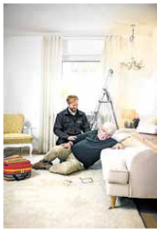
Malteser Hausnotruf – selbstbestimmt in den eigenen vier Wänden leben.

Mit einer App für Angehörige machen die Malteser den Hausnotruf jetzt noch sicherer: Mit der „Hausnotruf+“-App lassen sich über das Smartphone Gesundheitsdaten wie Medikationspläne einfach pflegen und wichtige Patienteninformationen sicher mit den Maltesern teilen. Die App informiert die Angehörigen außerdem per Push-Benachrichtigung, wenn ihre Lieben einen Hilferuf oder einen Einsatz ausgelöst haben, und erlaubt es ihnen, Kontakt mit dem Hausnotrufteam der Malteser aufzunehmen.