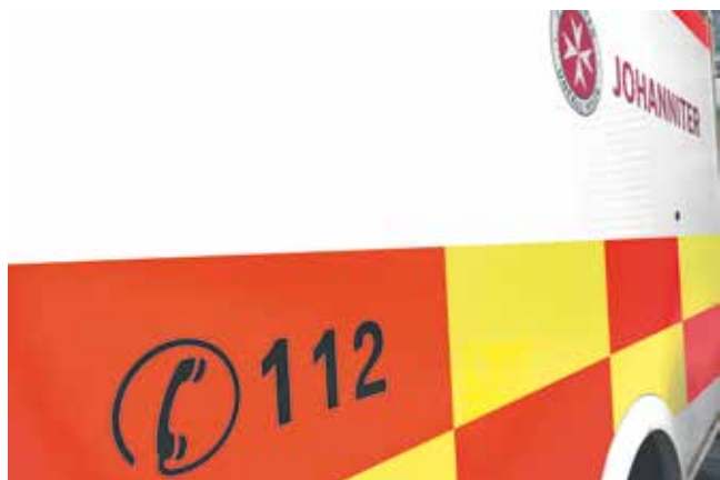
Besonders bei einer schweren Verletzung oder einem Herzstillstand kommt es darauf an, frühzeitig den Notruf 112 zu wählen.