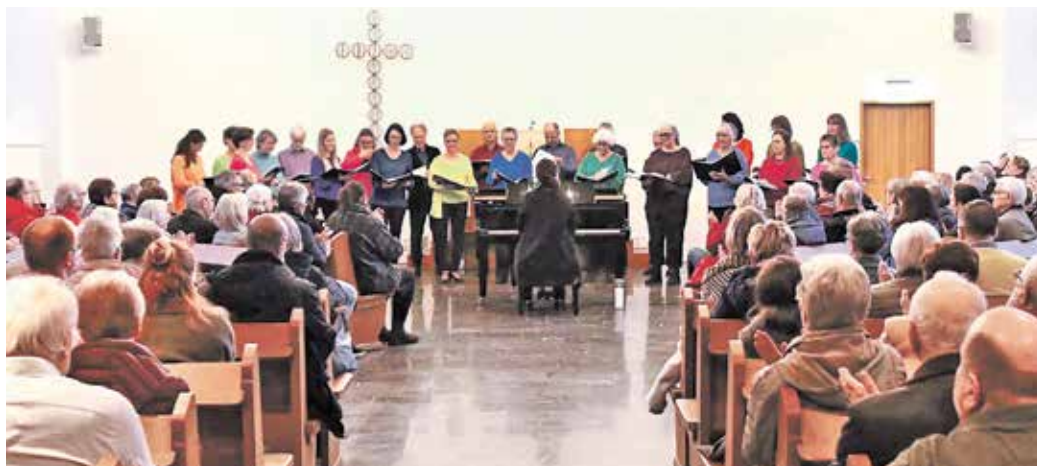
In der gut gefüllten Lutherkirche lauschten die Zuschauer dem Konzert und spendeten reichlich Applaus.

Song „Help“, ehe die Zuhörer die Kirche verließen – und gern eine Spende für die Kirchenmusik gaben.