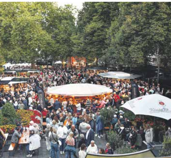
Auch in diesem Jahr findet Ende August wieder das Ronsdorfer Weinfest statt.

Der SV Jägerhaus Linde hat im letzten Jahr den Ronsdorfer Weihnachtsmarkt zum ersten Mal ausgerichtet. Trotz sehr kurzer Vorbereitungszeit berichtet der Fußballverein von viel positiver