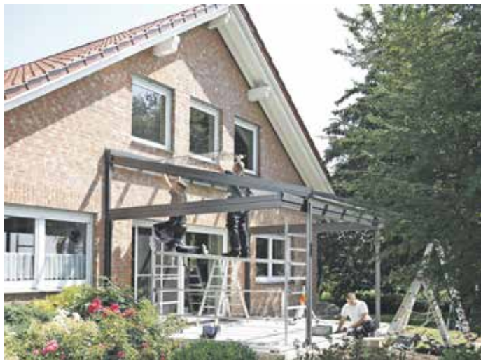
Auf Dauer sicher: Mit zertifizierten Terrassenbedachungen entscheiden sich Hauseigentümer für eine langlebige Lösung.

Wer billig kauft, kauft zweimal: Diese Erfahrung bestätigt sich immer wieder. Bei Terrassendächern kann es sogar gefährlich sein, wenn zugunsten eines niedrigen Preises die Qualität leidet. Die Rollläden und Sonnenschutz Innungen Köln, Düsseldorf und Aachen haben günstige Online-Angebote für Lamellendächer genauer unter die Lupe genommen – und dabei teils erschreckende Ergebnisse zutage gefördert.