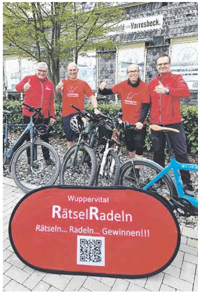
Vom 23. Mai bis 27. Juni sind Interessierte aufgefordert, die Stadt mit dem Rad zu erkunden und dabei Rätsel zu lösen.