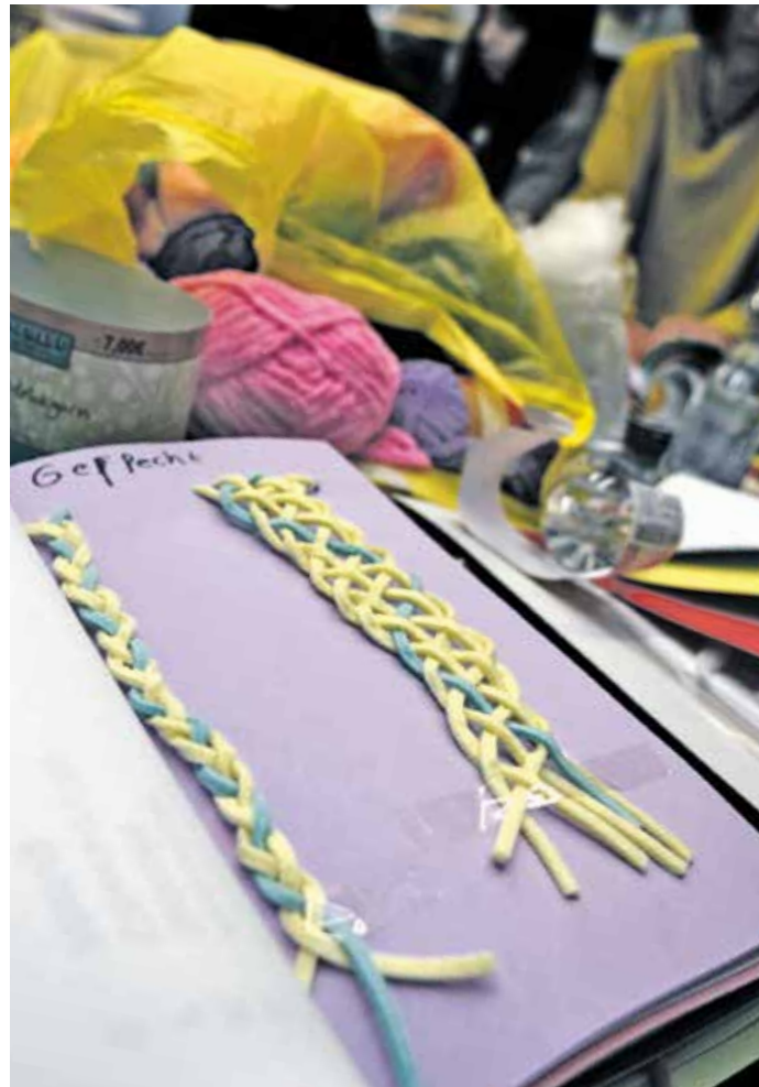
Im Laufe des Nachmittags stellten die Kinder und Jugendlichen ein Buch zusammen, in dem sie verschiedene Textilien kennenlernten.

Denn die Textilien sind häufig nicht mehr nutzbar und werden oft in großen Mengen in ärmere Länder exportiert, wo sie oftmals umweltschädlich entsorgt werden.