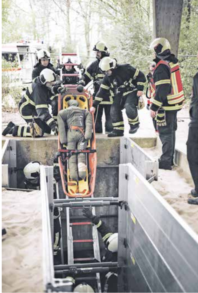
Zwei Tage lang übten mehr als 250 Einsatzkräfte am Institut der Feuerwehr in Münster. Verschiedenste Einsatzszenarien wurden erprobt – von der Personenrettung (links) bis zu Verkehrsunfällen (rechts).