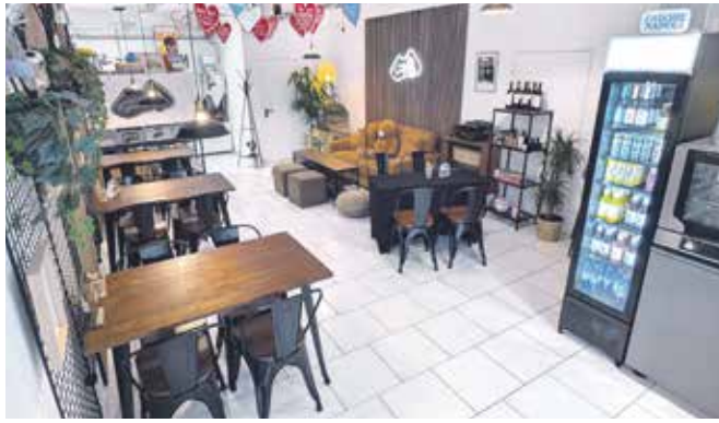
Die gemütliche Lounge lädt am Samstag zum Verweilen ein: Neben Kaffee und kalten Getränken gibt es auch neapolitanische Pizza und Cocktails.

Gechenkörbe mit verschiedenen italienischen Produkten, zu allen Anlässen und in verschiedenen Größen, stellt das Caffè Senatore auf Wunsch gerne zusammen. Ebenso werden Barista-Kurse angeboten, die sich großer Beliebtheit erfreuen und immer schnell ausgebucht sind – wie auch der nächste im Juni. Nach