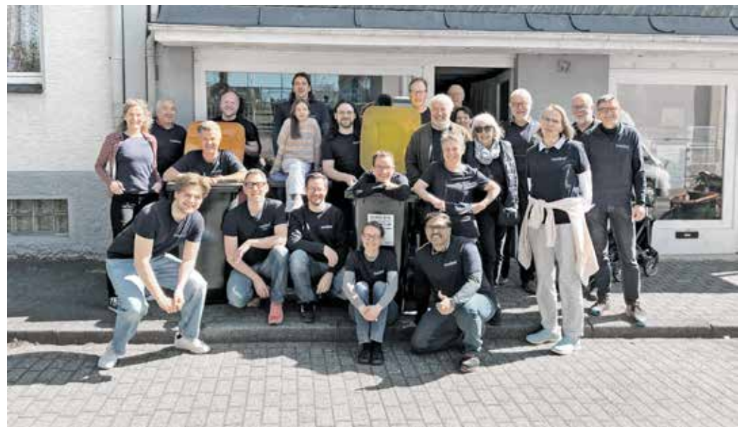
Ein Team von ehrenamtlichen Helfern setzt sich dafür ein, kaputte Dinge instand zu setzen.

NähCafé, Holzwerkstatt, Kreativ-Labor und TauschBar Im NähCafé können Kleidungsstücke repariert oder kreative Projekte umgesetzt werden. Und im KreativLabor wird's bunt: Kinder gestalten mit Fantasie und eigenen Händen persönliche Geschenke zum Mutter- oder Vatertag. Oder sägen in der Holzwerkstatt Holzherzen mit der elektrischen Feinschnittsäge. In der TauschBar können gut erhaltene, gebrauchte Dinge weitergegeben werden, ein Angebot, das Ressourcen schont und zugleich das gemeinschaftliche Teilen fördert. Wer etwas mitbringt, das anderen Freude bereiten könnte, darf sich im Gegenzug auf neue Lieblingsstücke freuen. Die TauschBar lädt zum Stöbern, Weitergeben und Entdecken ein, ganz im Sinne einer nachhaltigen und solidarischen Nutzung. Für alle, die einfach mal reinschnuppern möchten: Im Café gibt's Kaffee, Kuchen und Brötchen und natürlich nette Gespräche in entspannter Atmosphäre.