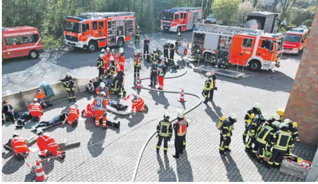
Auch die Zusammenarbeit von Feuerwehr und Rettungsdienst stand auf dem Programm.