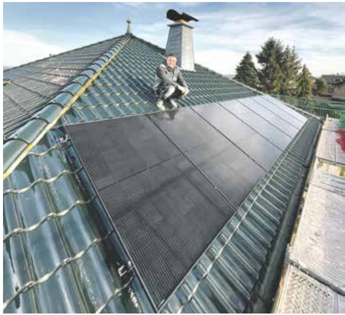
Erfolgreicher Abschluss: Das Dachdeckerhandwerk ist zusammen mit dem Elektrohandwerk der richtige Ansprechpartner für die Installation von PV-Anlagen.

Das Interesse an PV-Anlagen ist hoch. Für Bauherren ist es wichtig zu wissen, dass das Dachdeckerhandwerk, zusammen mit dem Elektrohandwerk, der richtige Ansprechpartner für die Installation von PV-Anlagen ist. Eine Studie des Bauherren-Schutzbunds (BSB) zeigt, wie wichtig sorgfältige Planung und Ausführung sind, um Fehler zu vermeiden. Unsachgemäßer Einbau oder falsche Auslegung in der Planungsphase sind laut der BSB-Studie häufige Fehlerquellen.