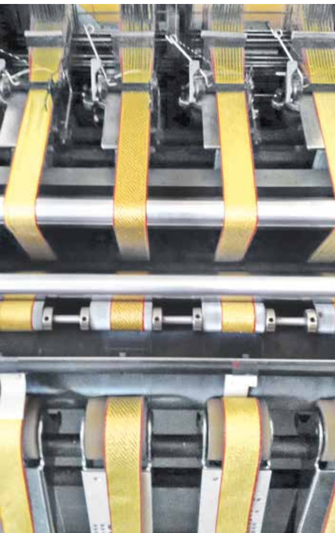
Das Weben von Bändern war Schwerpunkt des Bandwirkens in Ronsdorf.

Historische und zeitgenössische Ausstellungsstücke stehen beim Museumstag am 18. Mai 2025 von 14 bis 17 Uhr im Mittelpunkt. Ausgerufen wurde der Aktionstag 1977 durch den internationalen Museumsrat, woraufhin