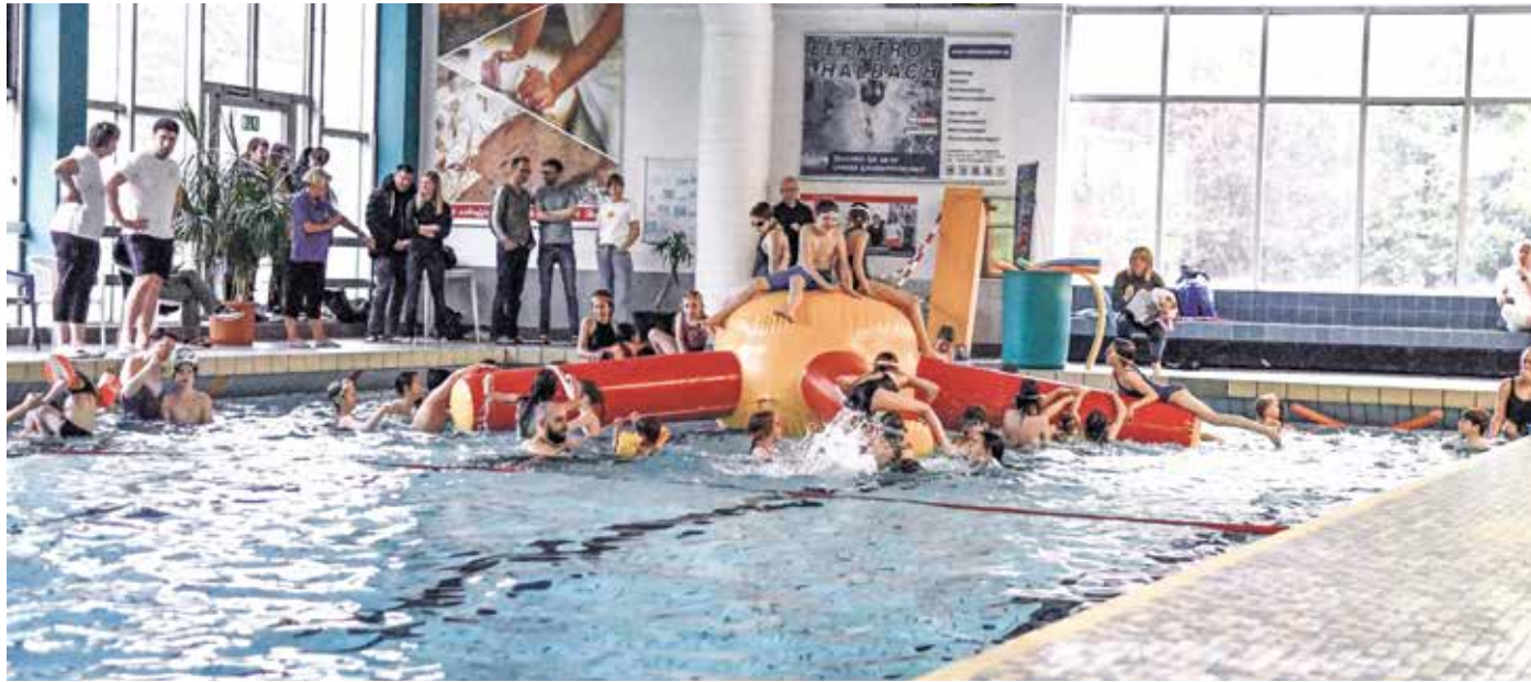
Die Riesenkrake sorgte bei der Premiere 2024 für viel Spaß bei den Kids und ist auch in diesem Jahr wieder dabei.