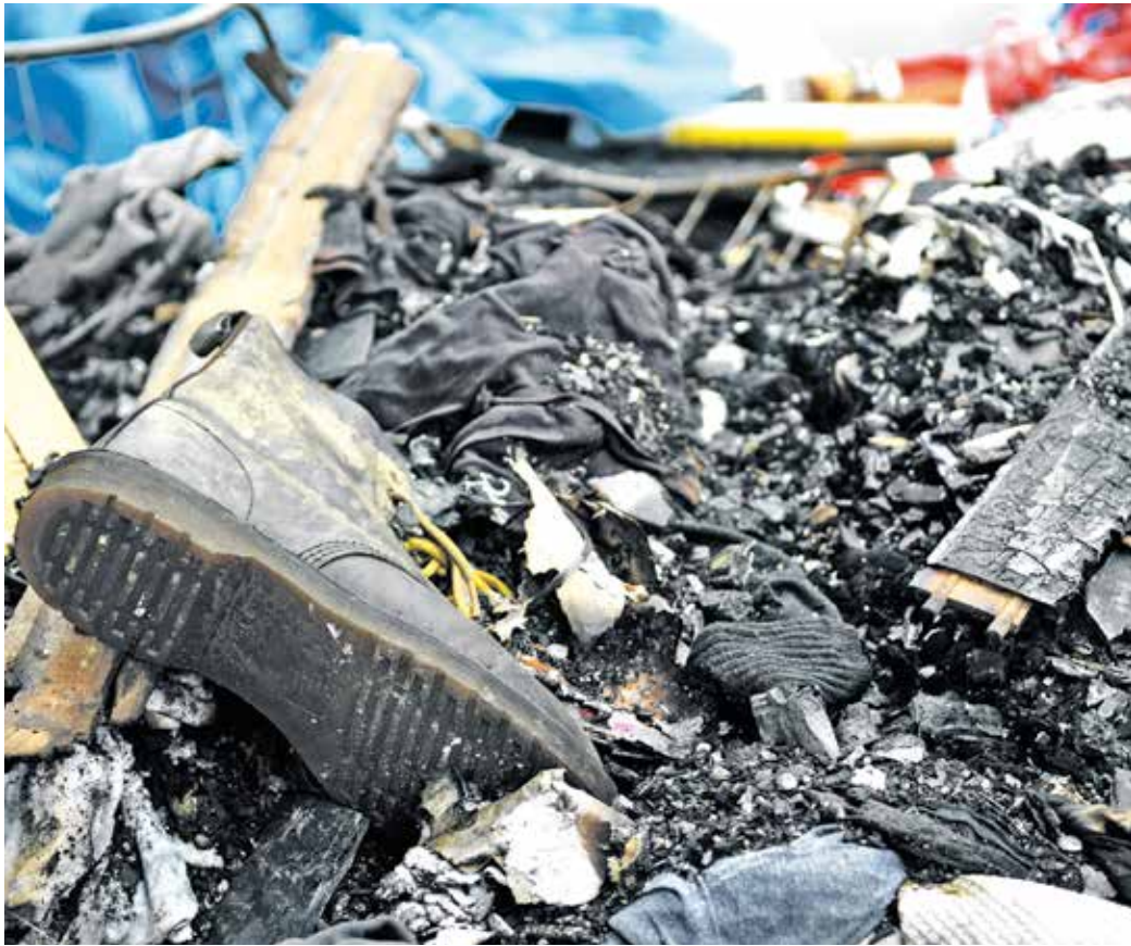
Das Hab und Gut der Bewohner ist dem Feuer zu großen Teilen zum Opfer gefallen.

Das seien in erster Linie die Nachbarn in der Talsperrenstraße aber auch Privatpersonen, Unternehmen und Kirchengemeinden aus Ronsdorf und der Umgebung, die vom Schicksal der Bewohner erfuhren, wie die