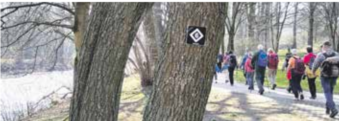
Wandergruppe auf dem Wupperweg (Route 6).

Die aktuelle Version der Broschüre von 2024 steht kostenlos als Download zur Verfügung unter www.wupperverband.de . Der Wupperverband ist verantwortlich für die Wasserwirtschaft im gesamten Flussgebiet der Wupper. 14 Talsperren, 11 Kläranlagen und 2.000 km Gewässer bilden für ca. 950.000 Menschen im Verbandsgebiet einen wesentlichen Teil ihrer Lebensgrundlage. „Der Schutz und die nachhaltige Bewirtschaftung der Gewässer stehen im Mittelpunkt sowie leistungsgerechte Kosten und maximale Leistung für Mitglieder und Bürger*innen. Wir sind als familienfreundliches Unternehmen zertifiziert“, so der Wupperverband.