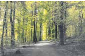
Frühlingsidylle im Barmer Wald.

Am Samstag, 26. April, Treff um 10 Uhr am Toelleturm, Hohenzollernstraße 33, können Interessierte mit ihm auf Entdeckungstour durch die Barmer Anlagen gehen. Mitführen sollte man die eigene Kamera oder das fotofähige Smartphone. Nützlich sind Kondition und festes Schuhwerk. Anmeldung per E-Mail an fotowanderung@wupper-galerie.de. Spenden werden für die Pflege des Toelleturms erbeten.