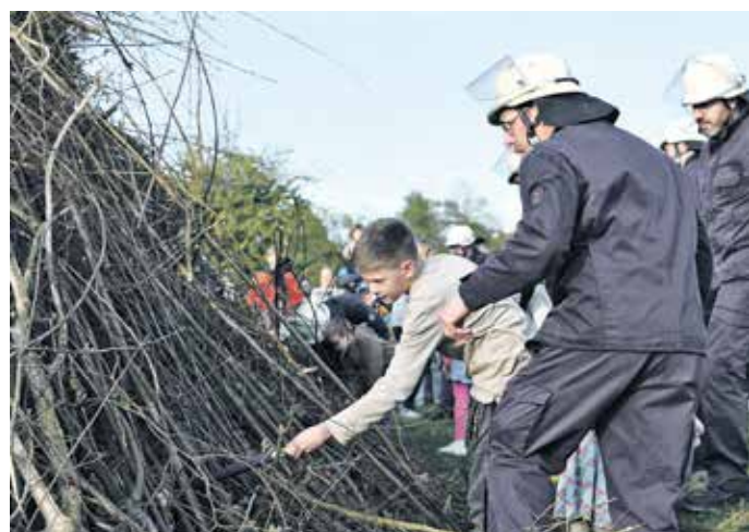
Vor dem Wind geschützt wurden die Fackeln entzündet, mit denen die jungen Gäste später das Feuer entfachen durften.

Hunderte Besucher zog das Osterfeuer am Karsamstag auf Heidt in diesem Jahr an. Die Heidter Feuerwehr bot Würstchen und