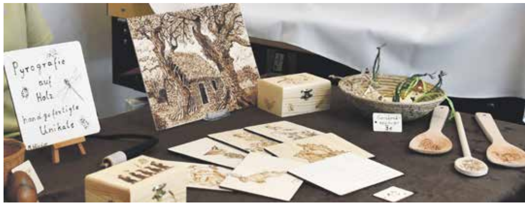
Die Aussteller präsentieren ihre Werke zum Verkauf.

Mehr als 50 Aussteller präsentieren im Innen- und Außenbereich