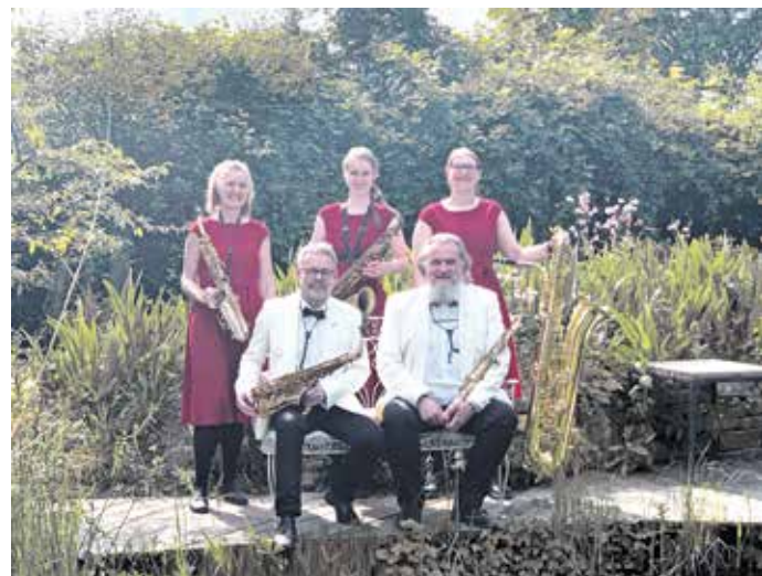
Einge Musiker von „Sax for fun“ sorgen für die musikalische Unterhaltung der Festbesucher.

zu vergnüglichen Stunden rund um den Toelleturm an der Hohenzollernstraße 33 ein.