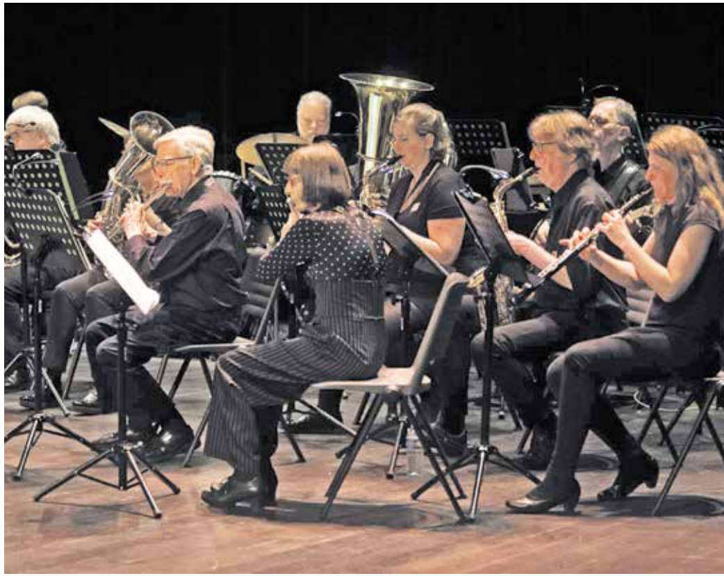
Das Orchester Harmonie de Côte Chaude – Saint Etienne zu Gast in Wuppertal.

Geplant sind zwei Freundschaftskonzerte: Am Freitag, 2. Mai, in der Eventlocation Palazzo, Kasinostraße 25, und am Samstag, 3. Mai, in der Aula der Erich-Fried-Gesamtschule in Ronsdorf. An der Blutfinke 70. Jeweils um 19.30 Uhr findet ein Freundschaftskonzert der beiden Bläserchöre „Harmonie de Côte Chaude – Saint Etienne (42)“ und „Ehrenmusikzug Löschzug Ronsdorf“ statt.