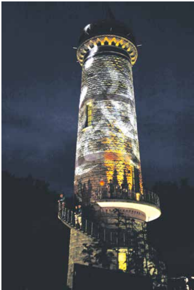
Zum Event „Wuppertal 24 Stunden live“ war der Toelleturm farbig illuminiert.

Bürger sind am Sonntag, 27. April, nach dem Treff um 15 Uhr am Toelleturm, Hohenzollernstraße 33, zu einer Zeitreise zurück ins Jahr 1864, dem Gründungsjahr des Barmer Verschönerungsvereins, eingeladen.