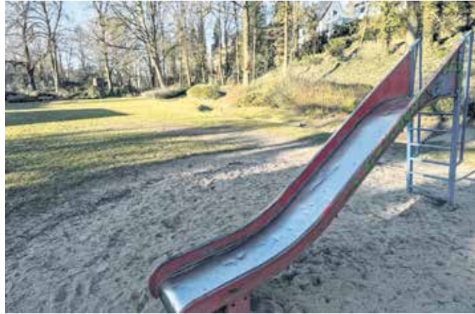
Der Spielplatz Am Grünen Streifen hat nur wenig zu bieten und wird großflächig ausgebaut.