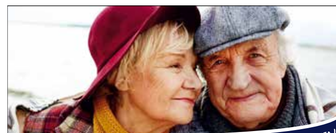
GUTE PFLEGE HAT EINEN NAMEN