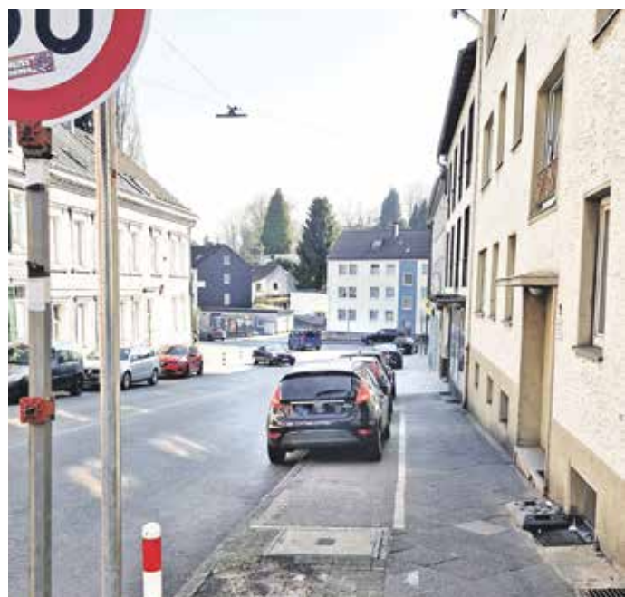
Blick von der Einmündung Monschaustraße bergab: Auch hier gibt es kein Schild, das Gehwegparken ausdrücklich erlaubt.

Wie die Verwaltung auf den Antrag reagiert und ob sie das zuvor tolerierte Bürgersteigparken wieder erlaubt, ist noch offen.