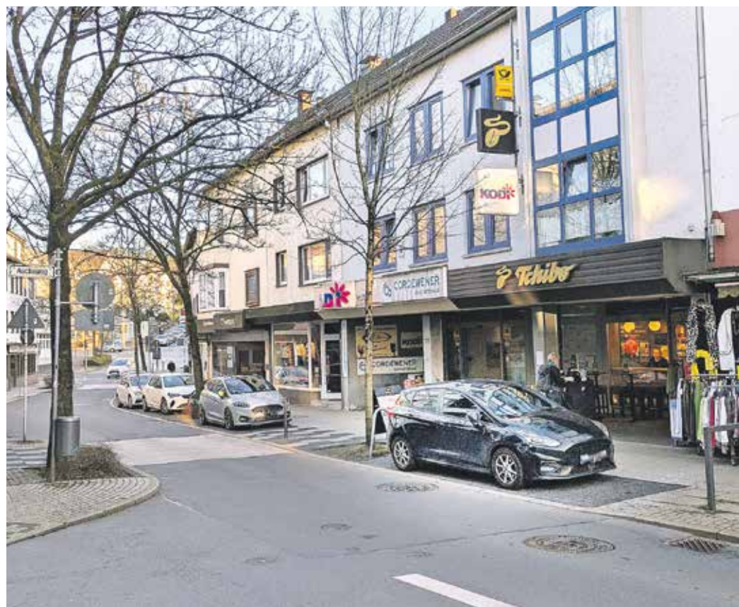
Auf dem vorderen Parkplatz rechts im Bild (schwarzer Pkw) will Tchibo nun einen Sonnenschirm, Tische und Stühle aufbauen.

Mit Ausnahme der SPD-Fraktion stimmten die BV-Mitglieder für den Antrag, die Außergastronomie wurde genehmigt.