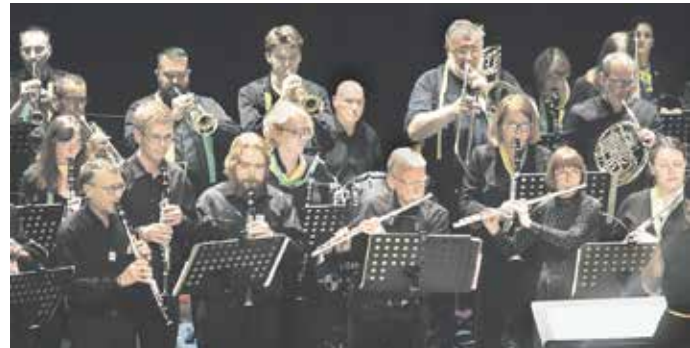
Musiker des PCR und HCC zu Besuch im La Comète in Saint Etienne am 29. April 2023.

Wer spenden will, findet weitere Informationen unter posaunenchor-ronsdorf.de .