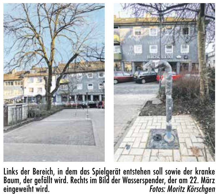
Links der Bereich, in dem das Spielgerät entstehen soll sowie der kranke Baum, der gefällt wird. Rechts im Bild der Wasserspender, der am 22. März eingeweiht wird.

Ein neues Spielgerät und ein Trinkwasserspender ergänzen den Bandwirkerplatz in der Zukunft. Außerdem wird ein „kranker“ Baum gefällt. Der Wasserspender wird am 22. März um 9 Uhr eingeweiht – im Rahmen der Aktionswoche „Wasser“ – und ist schon jetzt zu sehen (Foto). Das Kinderspielgerät entsteht direkt gegenüber dem Wasserspender und wird voraussichtlich noch in diesem Jahr eingebaut – wie genau es aussieht, steht allerdings noch nicht fest. Ein Zaun soll verhindern, dass die spielenden Kinder auf den anliegenden Parkplatz laufen. Für das Spielgerät hat die Bezirksvertretung 5.000 Euro aus dem Gemeindefinanzierungsgesetz (FGF) des Landes NRW umgewidmet. Die Gelder waren zuvor für Tische an den Bänken auf dem Bandwirkerplatz gedacht. Dieses Projekt hat die Stadt allerdings zunächst zurückgestellt,