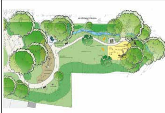
Der neue Spielbereich wird deutlich erweitert und mit vielen Spielgeräten ausgestattet. Grafik: Stadt Wuppertal

Für kleinere Kinder bis etwa acht Jahre wird ein Sandspielbereich gestaltet, der mit einer Schaukel, einem Spielkutter und einer Gerätekombination ausgestattet ist. Der Bereich bietet zudem Sitzmöglichkeiten für Eltern