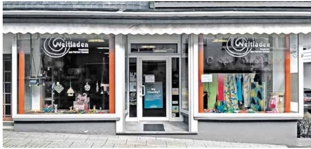
Für den Erhalt des Eine Welt Ladens in der Lüttringhauser Straße 1 ruft der „Aktionskreis Eine Welt“ zur Unterstützung auf.

Beim Betreiber des Eine Welt Ladens Ronsdorf, dem „Aktionskreis Eine Welt Wuppertal-Ronsdorf e.V.“ stehen in diesem Jahr in der Ordentlichen Mitgliederversammlung Neuwahlen des Vorstands an.