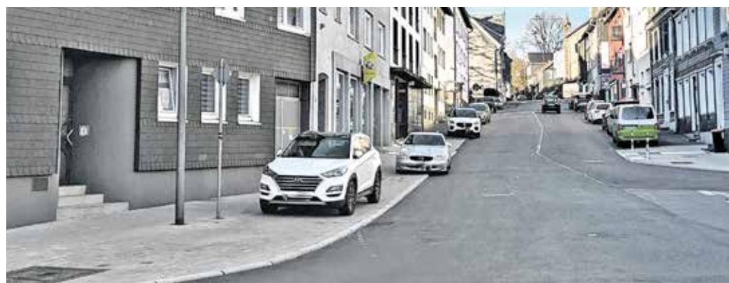
Bisher hatte das Ordnungsamt falsch parkende PKW an dieser Stelle – wie den weißen vorne im Bild – nicht verwarnet. Mit der Sanierung hat sich das aber geändert.