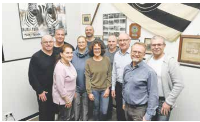
Ein Teil der zahlreichen Ehrenamtlichen, die sich beim TSV 05 Ronsdorf neben Familie und Beruf engagieren.

Insgesamt zeigten die Verantwortlichen sich aber zufrieden mit dem Fortschritt, der insbesondere auf das ehrenamtliche Engagement vieler zurückzuführen ist,