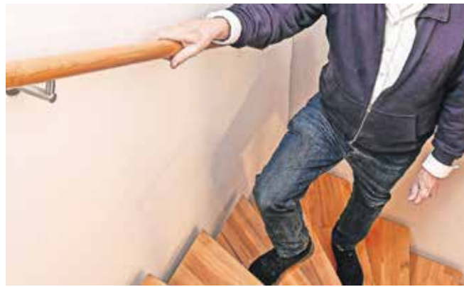
Für Sicherheit beim Treppensteigen sorgen die neuen Maßanfertigungen von Handläufen der Schreinerei Steinberg.

Massivholzhandläufe zeichnen sich durch eine hohe Widerstandsfähigkeit, Langlebigkeit und Unempfindlichkeit aus und erfreuen sich daher zunehmender Beliebtheit.