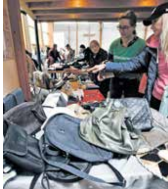
Auch Handtaschen standen am Samstag zur Auswahl.