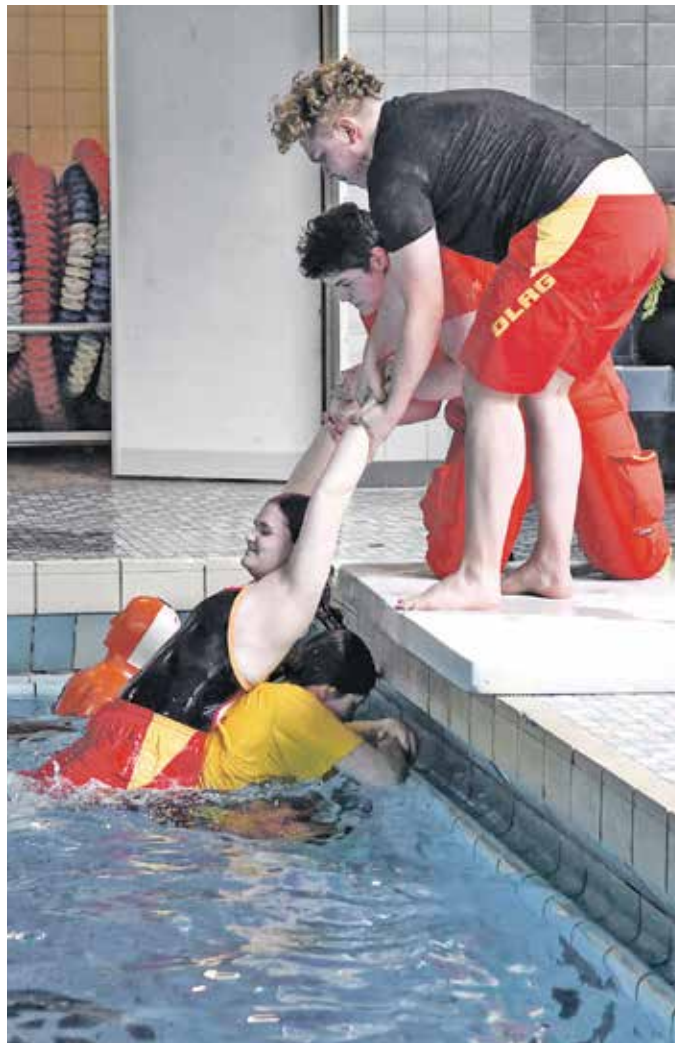
Teamwork war bei der DLRG die Devise.

Die Deutsche Lebens-Rettungs-Gesellschaft (DLRG) informiert über ihre Arbeit und zeigte in Vorführungen verschiedene Methoden zur Wasserrettung. Der rein ehrenamtliche Verein mit seinen 40 Mitgliedern ist in ganz Wuppertal für die Gefahrenabwehr rund ums Wasser zuständig. Im Bandwirker-Bad veranstaltet die DLRG jeden Donnerstag Schwimmkurse für seine Mitglieder – vom Seepferdchen bis zum Rettungsschwimmer.