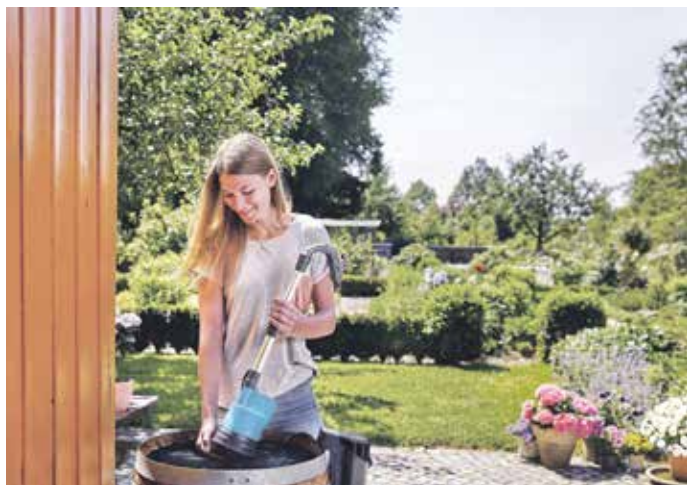
Mit einer modernen Gartenpumpe lässt sich das kostbare Nass leise und verlässlich aus einer Regentonne oder Zisterne für die Bewässerung nutzen.

Ohne ausreichend Wasser gedeihen weder die Pflanzen im Beet, noch wächst die Hecke. Dabei ist Trinkwasser aus der Leitung sicher die bequemste, aber auch teuerste Lösung für die Gartenbewässerung. Spätestens im Sommer, wenn die Trockenheit Pflanzen und Böden in Stress versetzt und das kühle Nass auch mal knapp wird, stellt sich die Frage nach alternativen Lösungen.