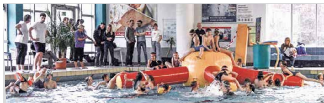
Mit der Riesenkrake tobten am Sonntag viele spielende Kinder im Becken.