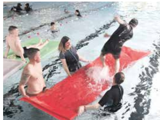
Im Wasser auf Matten balancieren, tauchen und mehr standen auf dem Programm.

In dieses umfangreiche Angebot rund ums Schwimmen mitten in Ronsdorf bot der Schwimm-Olymp einen kleinen Einblick – mit Erfolg. -mk