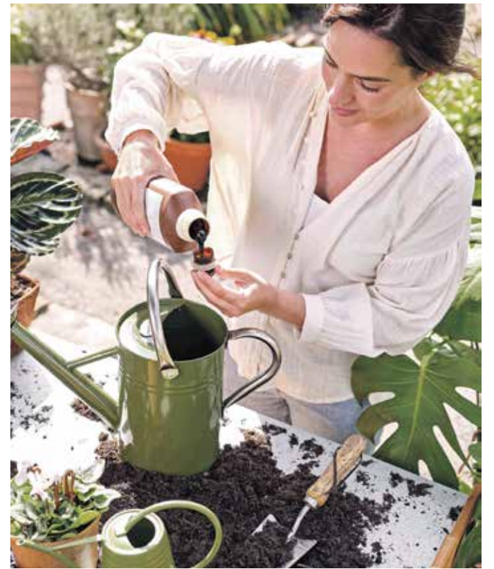
Die Pflege von torffreier Erde ist unkompliziert. Wichtig sind ausreichend Wasser und die richtige Nährstoffversorgung.

Die Verwendung der Substrate ist unkompliziert. Da torffreie Erden im Vergleich zur torfhaltigen Variante Wasser und Nährstoffe weniger gut speichern, sollten Gartenfreunde ihre Pflanzen häufiger auf ausreichend Feuchtigkeit kontrollieren und zudem regelmäßig düngen. Der Dünger sollte auf die torffreie Blumenerde abgestimmt sein. Bei der Kultivierung von Topf- oder Kübelpflanzen ist es hilfreich, der neuen Erde etwas Tongranulat beizumischen. Auf diese Weise können Wasser und Nährstoffe besser gespeichert werden. Torffreie Erde sollte nicht lange gelagert werden, da die Bestandteile im Vergleich zu Torf mikrobiell sehr aktiv sind. Zudem sollten Gartenbesitzer den Erdsack nicht zu warm lagern.