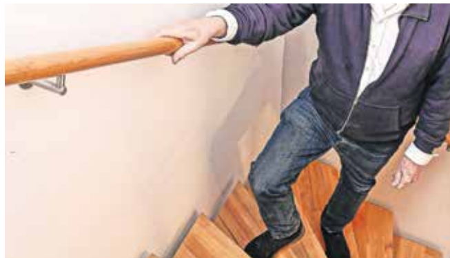
Für Sicherheit beim Treppensteigen sorgen die neuen Maßanfertigungen von Handläufen der Schreinerei Steinberg.

Die Schreinerei Steinberg stellt in der vierten Generation maßgefertigte Möbel aus Holz her und bietet dabei intelligente Lösungen – für die optimale Nutzung des vorhandenen Raumes. Neu im Sortiment sind jetzt Massivholzhandläufe nach Maß. Dabei fertigen die Experten der Schreinerei Steinberg für jede Treppe den passenden Handlauf aus hochwertigem Holz – ob modern oder klassisch – ganz nach den individuellen Wünschen der Kunden. Von der Beratung über das Aufmaß bis zur Herstellung und Montage sind diese beim Steinberg-Team in den besten Händen.