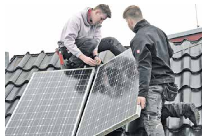
Die Zukunft des Wohnens und der Arbeit: Energiegewinnung auf dem Dach.

Fachgerecht heißt auch zu wissen, auf welchen Dacheindeckungen Solarmodule installiert werden dürfen, welche Abstände es dabei zu Dachöffnungen wie Rauchabzügen etc. einzuhalten gilt und wie z. B. Leitungsdurchführungen durch und über