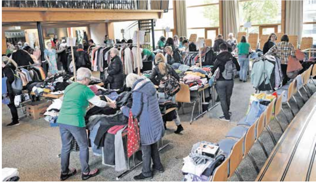
Der Andrang im Gemeinosaal an der Bandwirkerstraße war sehr groß.