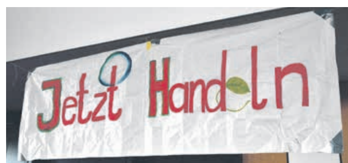
Die Forderung von „Schools4Future“ ist eindeutig: Nicht mehr lange (fossile Energieträger ab-) tackeln, sondern handeln.

Die große Mehrheit der Deutschen (rund 80 Prozent) lehnen die Klimaprotestaktionen der „Letzten Generation“, bei denen sich Mitglieder auf Straßen festkleben, ab, erklärte Engels zunächst. Historisch habe sich aber gezeigt, dass Proteste nicht beliebt sein müssen,