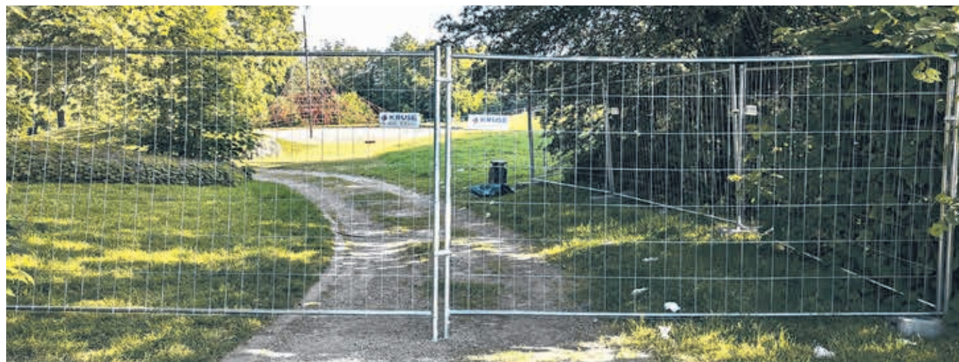
Am Montag haben die Vorbereitungen angefangen, der Spielplatz ist jetzt abgesperrt.