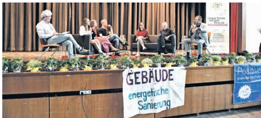
Nach den Gastbeiträgen diskutierte unter anderem Oberbürgermeister Uwe Schneidewind (rechts).

Mehr Infos zum Klimaschutzprojekt an Schulen unter www.schoolsforfuture.net .