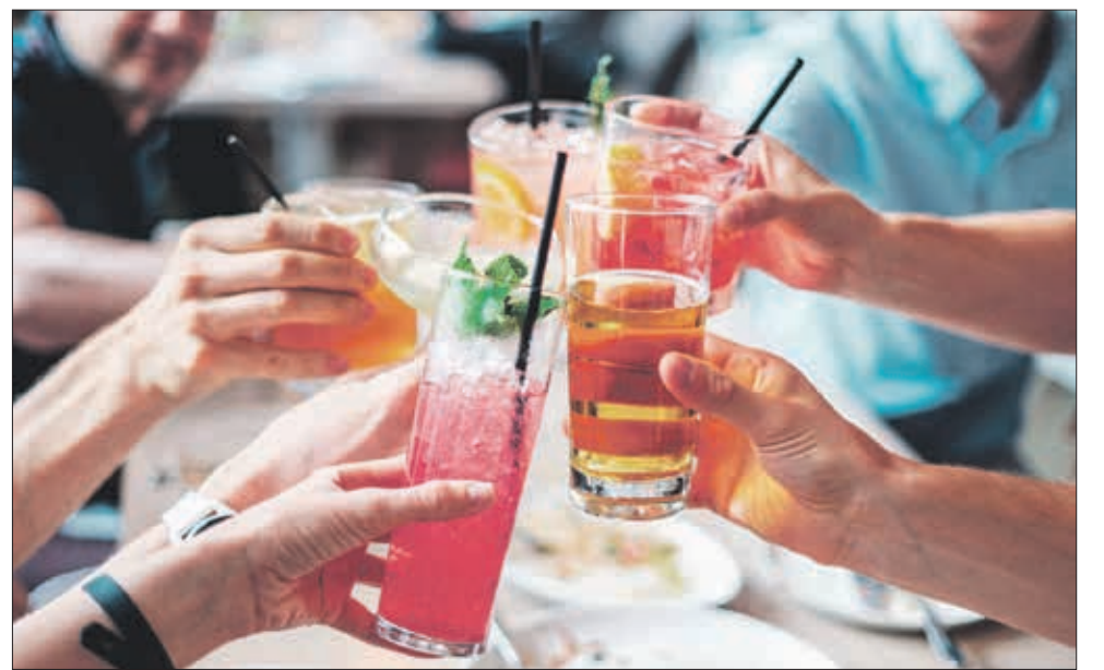
Beim Feiern an lauen Sommertagen sollte man wenig oder gar keinen Alkohol konsumieren oder Auto und auch Fahrrad stehen lassen.

Lange Sommertage und -abende bieten sich draußen für ausgelassene Feiern an.