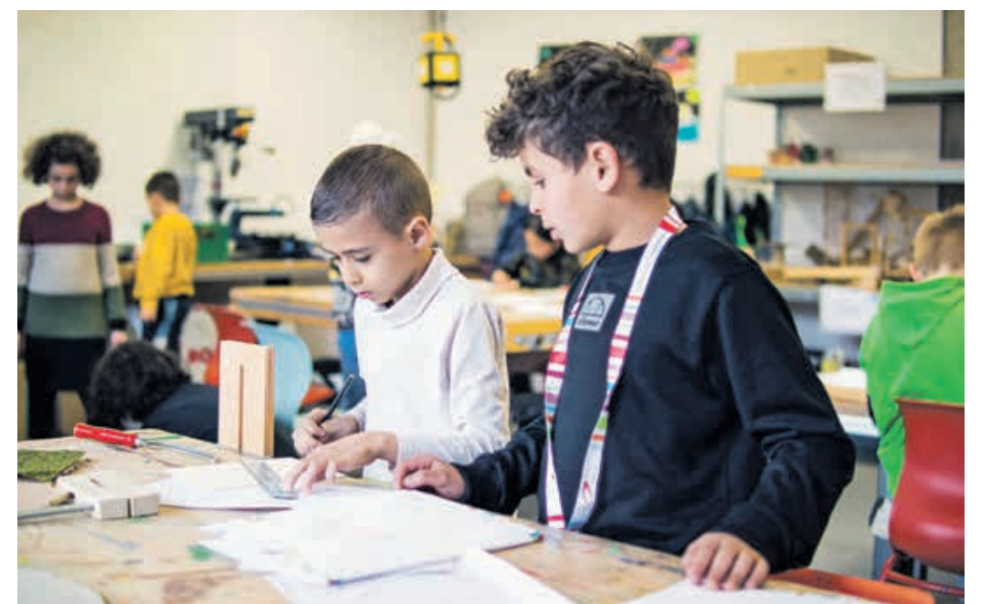
Im Kurs „Stadt & Verkehr – selbst geplant und selbst gebaut“ können Studierende der Junior Uni in den Sommerferien ihre Stadt der Zukunft entwerfen.

Auch in diesen Sommerferien ist in der Wuppertaler Junior Uni für das Bergische Land einiges los: Junge Nachwuchsforscher können in den sechs Wochen Ferienzeit zu Vogelexperten werden, Stadtplanung unter die Lupe nehmen und eigene Städte entwerfen, die Geheimnisse der Pflanzenwelt entdecken oder eigene Spiele programmieren. Für Jugendliche stehen berufsorientierende Themen im Mittelpunkt der Kurse.