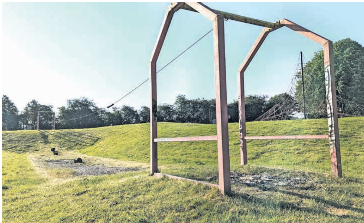
Die Seilbahn ist schon lange in einem schlechten Zustand und nicht nutzbar.