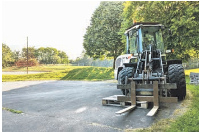
Das schwere Gerät steht bereit.

Wenn alles wie geplant klappt, sollen die Bauarbeiten im Oktober dieses Jahres beendet werden. Für die Sanierung sind Kosten in Höhe von 556.000 Euro eingeplant.