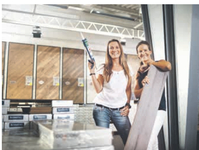
Die Mitmachstationen sind die Highlights der beliebten Workshopreihe.

Der Frauen-Workshop in Wuppertal findet von 18.45 bis 21.30 Uhr statt und richtet sich an neugierige Anfängerinnen, aber auch an geübte Heimwerkerinnen, die ihr Knowhow im Bereich Hartboden erweitern möchten. Die Teilnahme ist kostenlos, Anmeldungen sind über die Website möglich: laminatdepot.de/frauenworkshops .