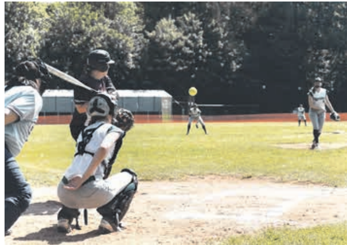
Die Damen starteten stark, unterlagen aber schließlich.

Im Baseball setzten sich die Wuppertaler Stingrays an der Oberbergischen Straße am Wochenende gegen die Bochum Barflies durch. Nach gut zweieinhalb Stunden Spielzeit gewannen die Bayer-Baseballer mit 18:5.