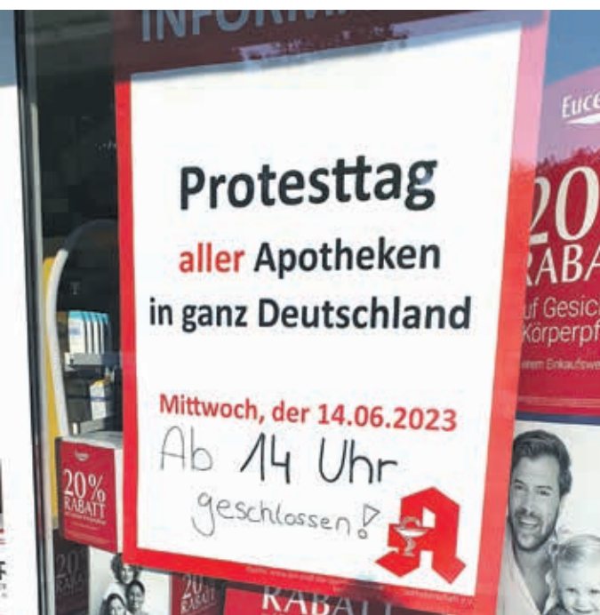
Die Ronsdorfer Apotheken haben sich abgesprochen und schließen ab 14 Uhr ihre Türen. Am folgenden Tag ist wieder regulär geöffnet.

Apotheker in ganz Deutschland appellieren am Mittwoch, 14. Juni, an die Politik, Verbesserungen für ihre Branche auf den Weg zu bringen. Daher schließen die Apotheken in Ronsdorf – wie viele andere im Land – an diesem Tag ab 14 Uhr ihre Türen. Die Notdienste sind erreichbar (siehe Info-Kasten).